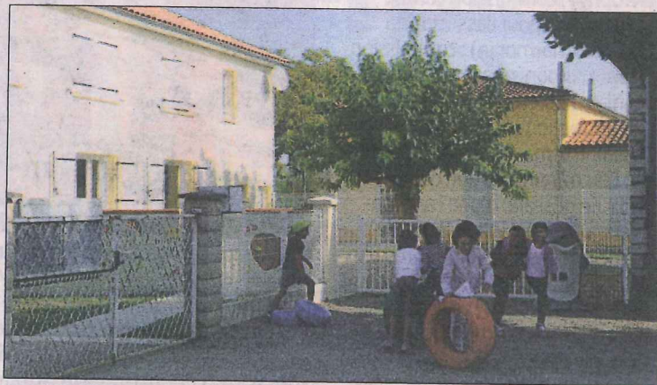
Les bâtiments de la garderie (à gauche) et de la mini-crèche (au second plan) voisinent avec l'école.

Nouveaux rythmes installés À Fauguerolles, l'optimisme est donc de mise. Désormais, l'effectif